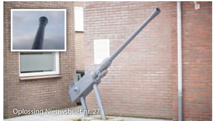
Oplissing Nieuwsbrief nr. 27

Met dank aan fotograaf Gilbert Bieshaar lieten we u in voorgaande nieuwsbrieven mooie beelden van typisch Oostburgse plekjes zien én testten we u op uw kennis van Oostburg! Ook in dit nummer is dat nog het geval. Maar vanaf de komende nieuwsbrieven nodigen we alle inwoners en ondernemers uit om zelf sfeervolle foto's van Oostburg naar ons te mailen, met een toelichting op waarom juist deze plek tot de verbeelding van de fotograaf spreekt. Want Oostburg kent vele, en soms ook verborgen, mooie locaties die Oostburgenaars zelf als geen ander kennen. De meest aansprekende foto's plaatsen we met vermelding van naam en toelichting in deze nieuwsbrief, als 'traktatie' voor alle lezers. Laat u dus van uw meest fotogenieke kant zien en mail uw foto naar nieuwsbrief@aanrekkelijkoostburg.nl !